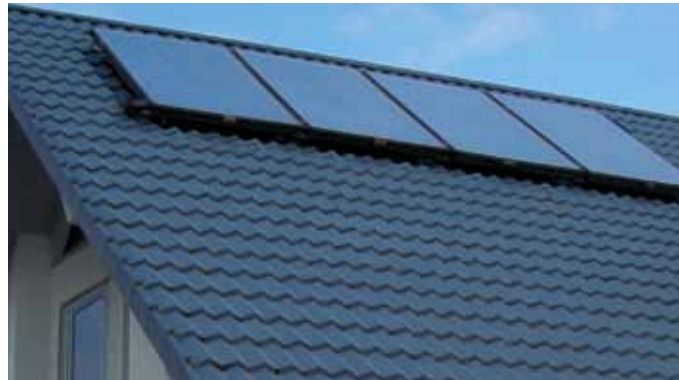
Solkollektoren sind ein aktiver Beitrag zum Klimaschutz.

Die Details zur Aktion , die bis 31. Dezember 2012 gültig ist, erfahren Sie im Internet unter: www.1to1energy.ch/solaraktion