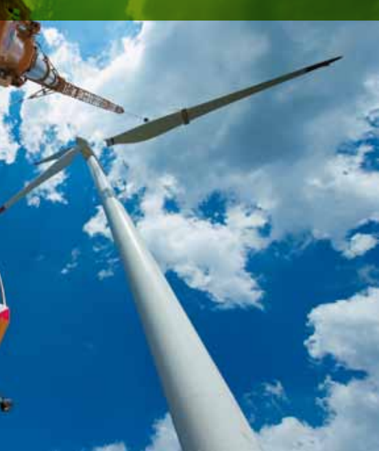
en «Colossus» bringt Kurt Hilfiker in 95 Metern e Monteure an der Gondel befestigen können.

auch eine logistische Meisterleistung, damit das erforderliche Material trotz der knappen Platzverhältnisse auf dem Mont-Crosin und der teilweise engen Zufahrtswege für die Schwertransporte von Basel in den Jura rechtzeitig auf der Baustelle vorhanden ist. In der Planung spielten auch stets Umweltaspekte eine sehr wichtige Rolle, wie Mägli unterstreicht. Dies beginnt beim Transport der verschiedenen Turbinenteile, die aus Spanien, Dänemark und Deutschland weitestgehend per Schiff nach Basel transportiert wurden, und führt auch zu «Colossus»: Dieser benötigt gegenüber einem herkömmlichen Gittermastkran deutlich weniger breite Fahrwege, kleinere Montageflächen und weniger Materialzusatz-Transporte. Die Umwelt freuts.