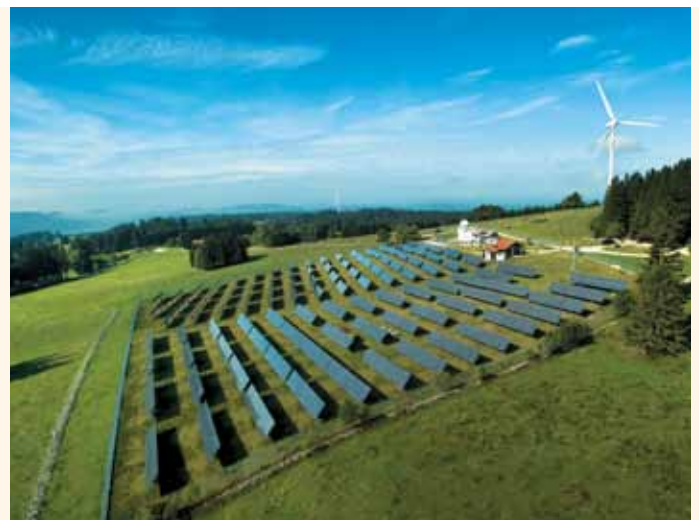
Mont-Soleil beherbergt seit dem Aufbau im Jahr 1995 das bedeutendste private Fotovoltaik-Testzentrum der Schweiz.

und Entwicklung der Sonnenenergie investiert. Nebst der Unterstützung für die genannten Projekte hat sie insbesondere 1991/92 das damals grösste Sonnenkraftwerk Europas erbaut, ab 1995 das bedeutendste private Fotovoltaik-Testzentrum der Schweiz aufgebaut sowie gezielte, international anerkannte Forschungs- und Informationsarbeit für 750 000 Besucher geleistet. www.societe-mont-soleil.ch