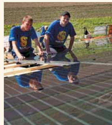
Auch Lernende packten beim Bau der Anlage an.

gründete die pvenergie AG. Unter deren Federführung wurde das 1885 Quadratmeter grosse Solardach gebaut. Am Projekt beteiligten sich unter anderem die Industrielles Betriebe Langenthal (ibl). Lernende der ibl haben im Rahmen eines Lehrlingsprojekts auch mitgeholfen, die Anlage zu montieren, die nun jährlich rund 250000 kWh Sonnenstrom produziert – genügend elektrische Energie also für rund 65 Haushalte.