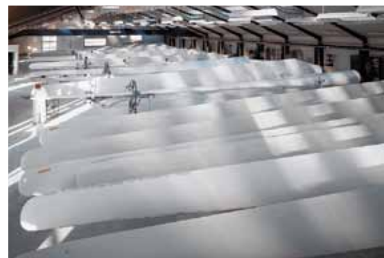
Die Fertigung der Rotorblätter ist eine der Spezialitäten von Vestas.