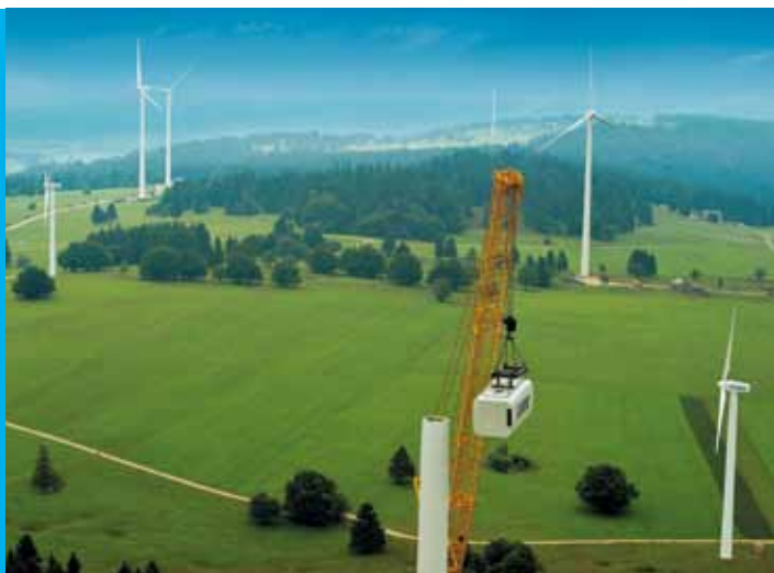
Der Windstrom vom Mont-Crosin erfüllt die hohen Anforderungen des Gütesiegels «naturemade star».