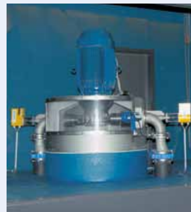
Im Tropenhaus wird Strom aus Trinkwasser produziert.