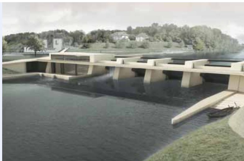
Das alte Wehr des Wasserkraftwerks Hagneck wird bis 2015 durch das Projekt «Tiefgang» ersetzt.

Das Siegerprojekt trägt den Anliegen der Denkmalpflege, des Heimatschutzes und dem Hochwasserschutz Rechnung – und bringt Funktionalität sowie Effizienzsteigerung mit optimaler Gestaltung in Einklang. Die zwei Rohrturbinen des neuen Wehrs ermöglichen die Erhöhung der Stromproduktion um rund 35 Prozent auf 107 GWh.