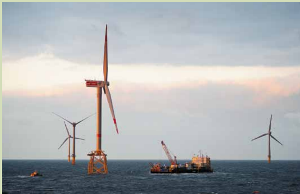
Deutschlands erster Offshore-Windpark, «Alpha Ventus», ging im April ans Netz.

Offshore geben bisher die Europäer den Ton an: Ende 2009 produzierten in neun Ländern total 828 Offshore-Windturbinen mit einer Gesamtleistung von 2056 MW Windstrom – Tendenz stark steigend. Allein im ersten Halbjahr 2010 wurden weitere 118 Turbinen in sechs Windparks mit dem Stromnetz verbunden, darunter auch der erste Offshore-Windpark Deutschlands, das Pilotprojekt «Alpha Ventus»; total befinden sich in europäischen Gewässern 16 Offshore-Windparks im Bau, was nach Fertigstellung die Gesamtleistung auf dem Alten Kontinent mehr als verdoppeln wird.