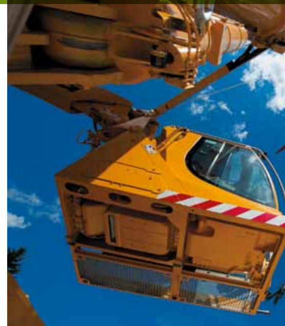
Beeindruckende Präzision: Mit Hilfe des imposanten Höhe das dritte Rotorblatt in Position, damit es die

bevor im August 2009 der Spatenstich für die effektiven Ausbaurbeiten erfolgen konnte, mussten zahlreiche Hürden genommen werden. In diesem Prozess suchten die Verantwortlichen stets den Kontakt mit Natur- und Landschaftsschutzverbänden und involvierten zudem immer die lokale Bevölkerung. Damit folgten sie dem Credo, dem sie sich schon seit über 15 Jahren verpflichten. Auch während der Ausbauphase sind Bevölkerung und Landbesitzer stets involviert.