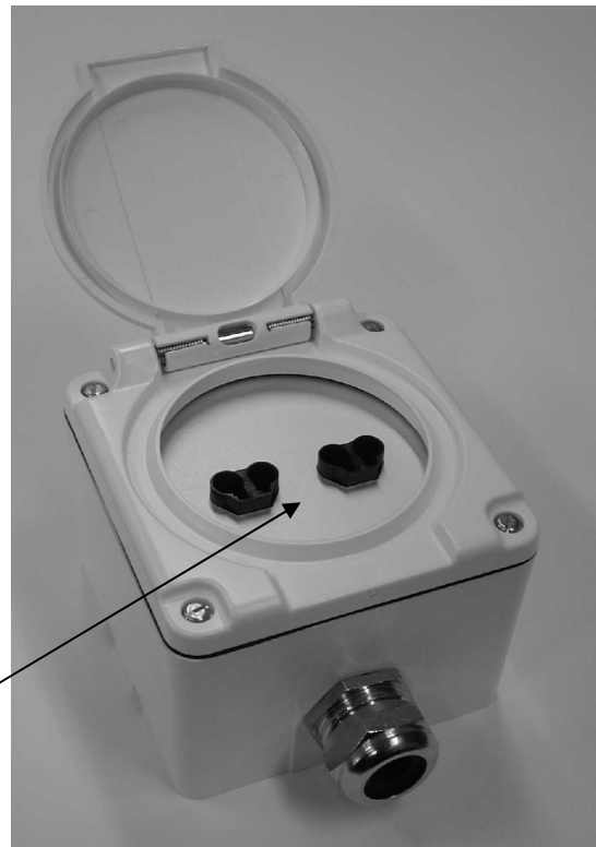
Steckerplatte mit CS-Schnittstelle