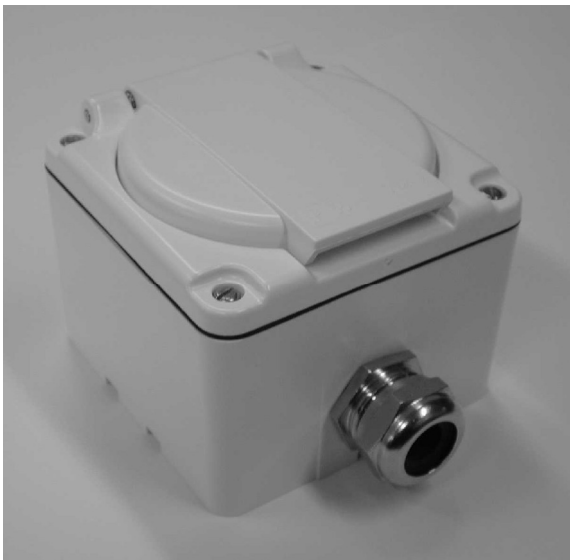
Gehäuse NAP Feller