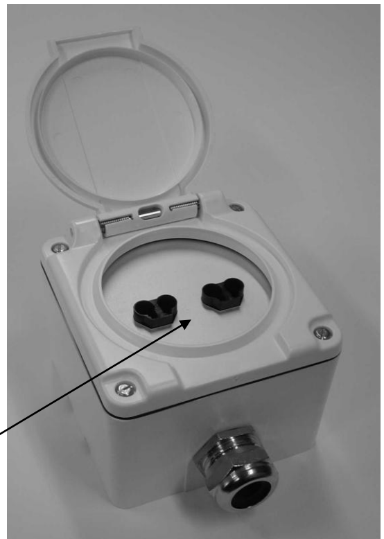
Steckerplatte mit CS-Schnittstelle