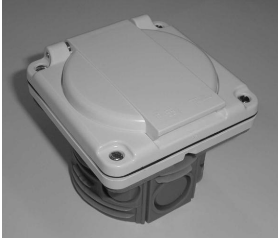
Gehäuse NUP Feller